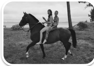
Amélie, Polo et Utah Balade à cru à Gatseau