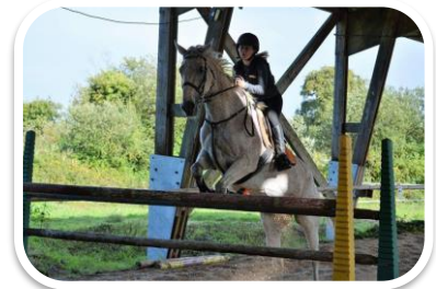
Marine et Minndar Puissance - 135cm