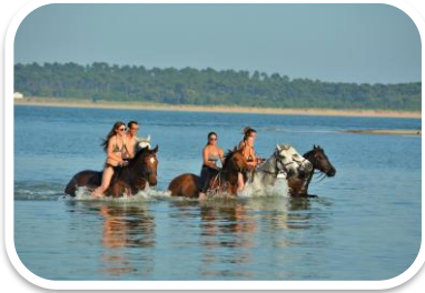
Petit bain de mer à Gatseau

Pour cette newsletter, nous avons choisi de mettre en avant vos exploits, vos bons souvenirs à cheval. Merci à tous de nous faire rêver avec vos meilleurs moments à cheval.