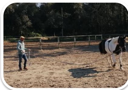
Travail à la longe DAYTONA