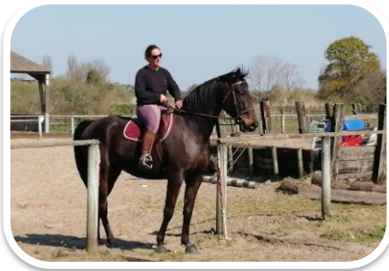
Séance sur le plat CALIF