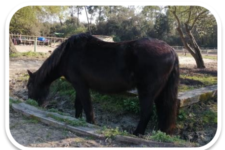
Nettoyage des fossés VICTORIA