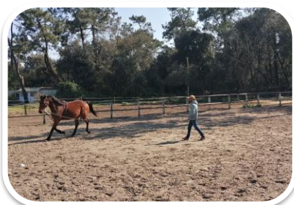
On trotte à la longe PERPET'