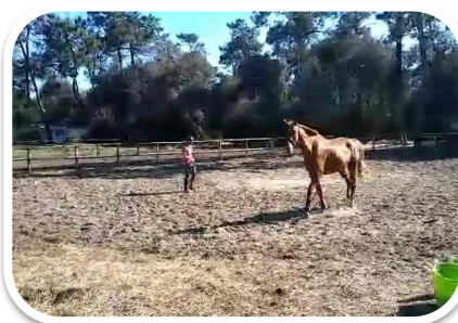
« Le travail s'est trop dure » MAJORELLA