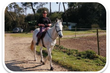
Un petit tour en forêt ICE CUBE